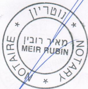
חתימת הנוטריון Notary's Seal

A large, decorative red ribbon signature. The ribbon is tied into a large, multi-layered bow with a scalloped edge. A long tail of the ribbon extends upwards from the top of the bow. Below the ribbon, there is a horizontal line and the text 'חותם הנוטריון' (Notary's Signature) and 'Signature' in English.